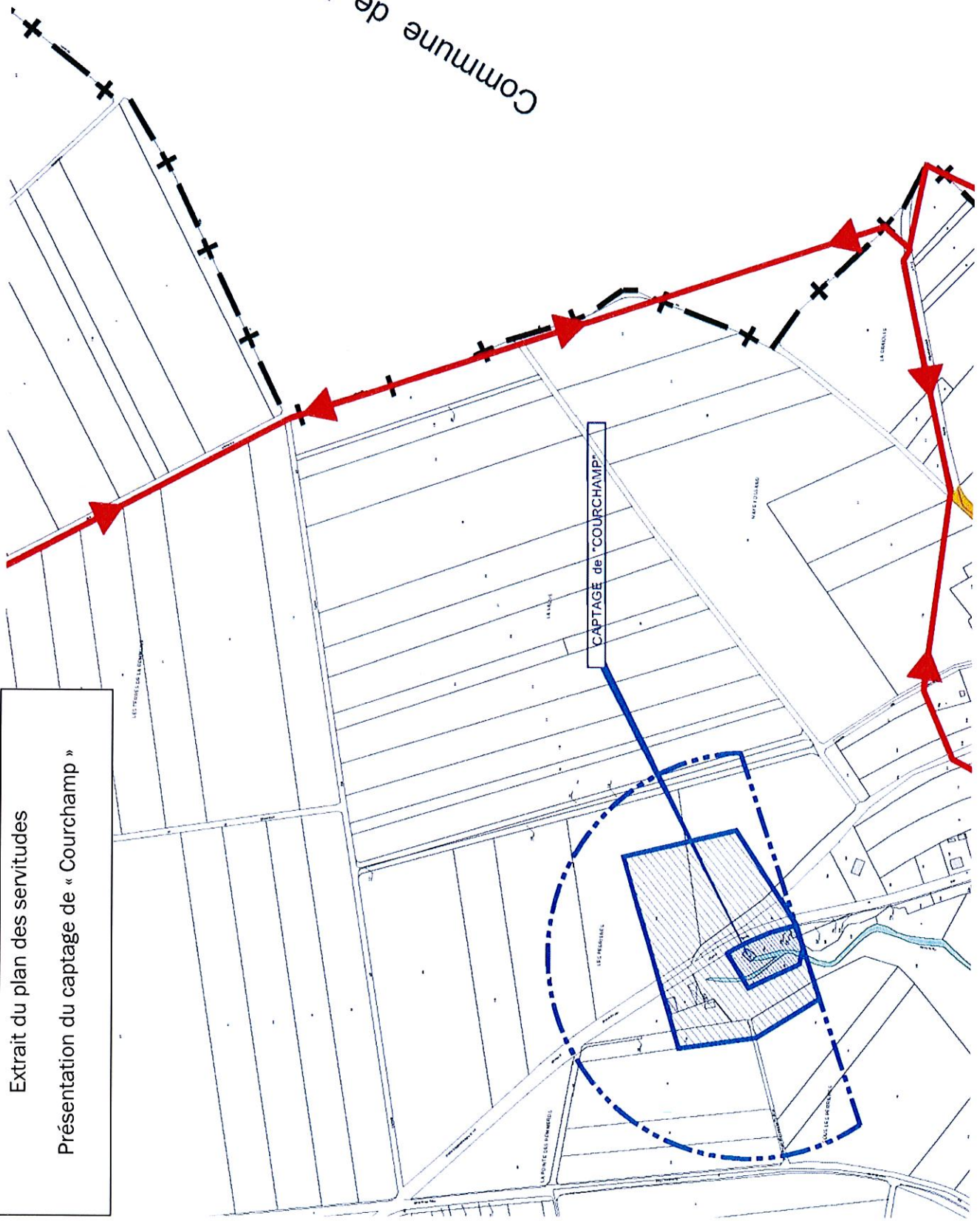
Extrait du plan des servitudes Présentation du captage de « Courchamp »